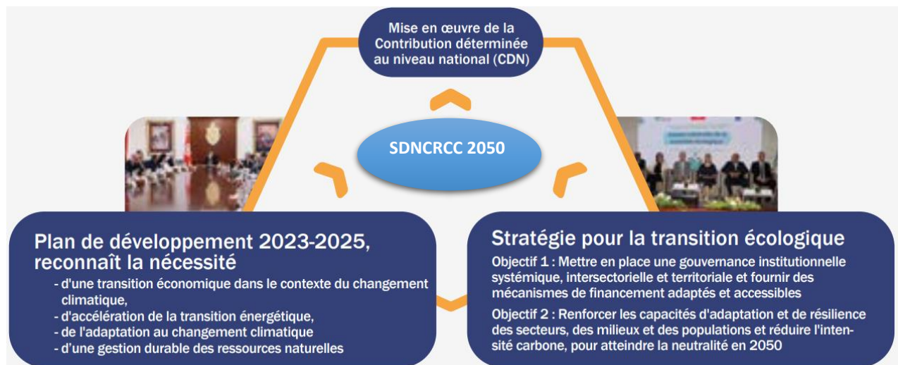
Figure n° 1 : principales stratégies du Pays en matière des changements climatiques